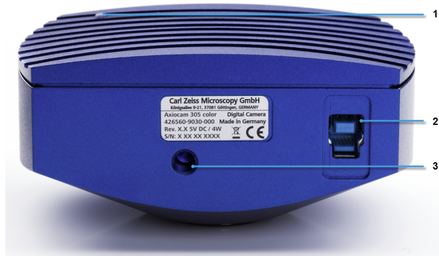
Abb. 5.1: Kamera (Rückseite)