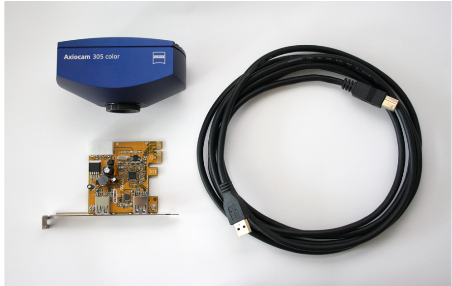
Abb. 4.1: Lieferumfang Axiocam 305 color