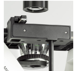
Perilla coaxial para desplazamiento en x/y, Posible colocación izquierda o derecha