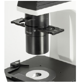
N.A. 0,3 Condensador Abbe con deslizador de contraste de fases